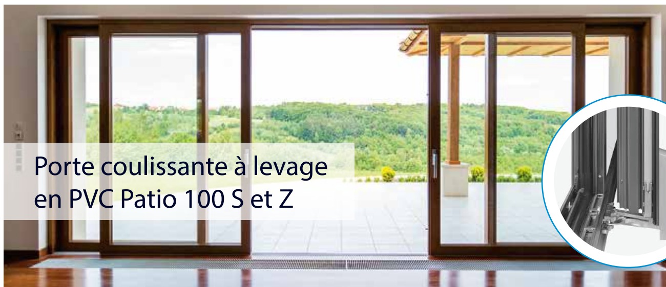
Porte coulissante à levage en PVC Patio 100 S et Z