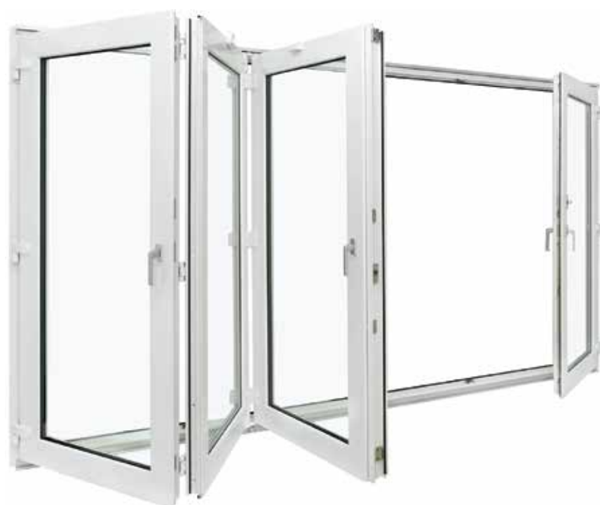
Porte coulissante accordeon en PVC Patio Fold